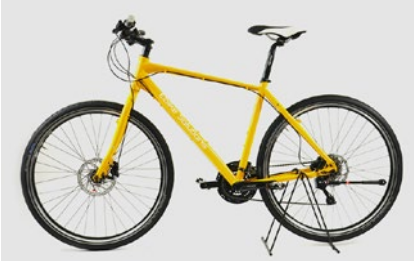
1. Gesamtansicht von links