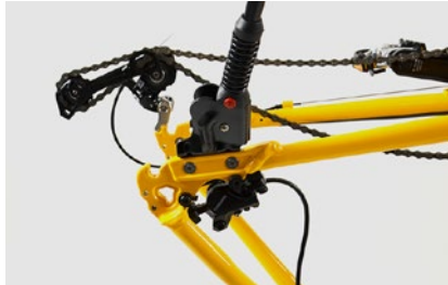
8. Ausfallende ohne Laufrad