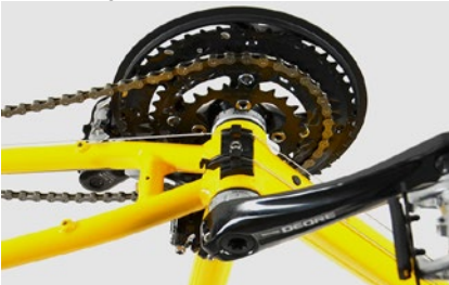
7. Tretlager von der Seite