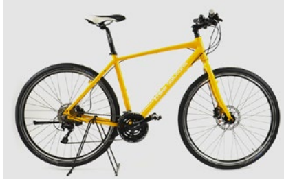
2. Gesamtansicht von rechts