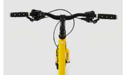
3. Lenkeransicht von oben