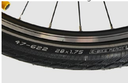
5. Mantel mit Größenangaben